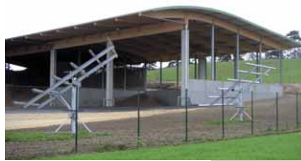
Der Sonne entgegen: Vor der neuen Hackschnitzelhalle der Biomasse Wolkersdorf wurden zwei Photovoltaik-Mover aufgestellt, die künftig für zusätzlichen Naturstrom sorgen.

Reges Treiben herrscht ebenfalls am ÖkoEnergie-Unterneh-