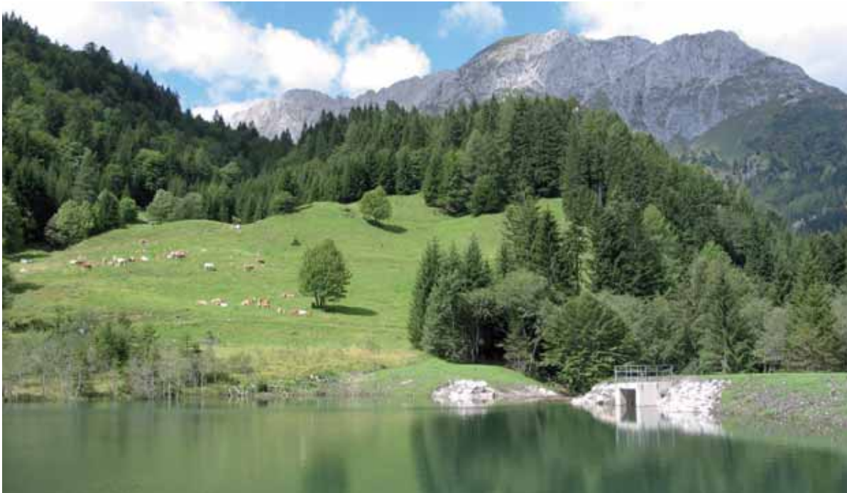
Drei Stauseen speichern den Strom des neuen Kleinwasserkraftwerkes