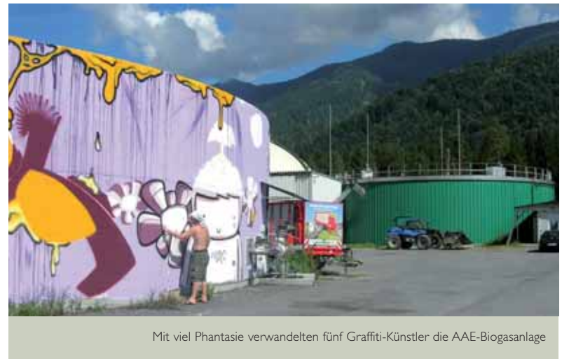
Mit viel Phantasie verwandelten fünf Graffiti-Künstler die AAE-Biogasanlage

Unter dem Motto „Energy Painting – Mir ist nicht egal, woher der Strom kommt!“ veranstalteten die AAE und das Landesjugendreferat Kärnten einen Graffiti Contest. Fünf Gewinner aus Österreich und der Schweiz gestalteten in einer Naturabenteuerwoche Ende August die 220 m 2 große Wand der AAE-