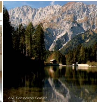
AAE Kleinspeicher Grünsee