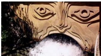
Wassermaul des AAE Schalkkraftwerks Hydro-Solar

gung. Umfassendes Umweltengagement steht bei „Energisch“ im Vordergrund. Ein Kernziel der Agentur ist es, dazu beizutragen, dass Österreich durch eine 100% saubere Energieversorgung unabhängig von nuklearen und fossilen Energieträgern wird.