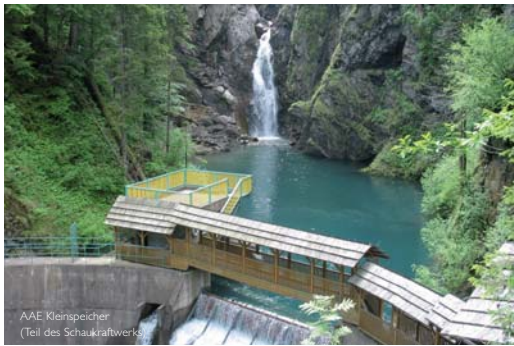
AAE Kleinspeicher (Teil des Schaukraftwerks)