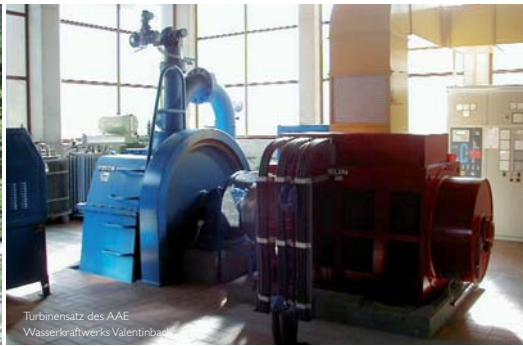
Turbinensatz des AAE Wasserkraftwerks Valentinbach