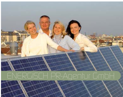
ENERGISCH PR-Agentur GmbH

Für eine lebenswerte Umwelt entstand im Jahr 1999 die Wiener „Energisch PR-Agentur“ für Öffentlichkeitsarbeit. Sie betreut Unternehmen aus dem Bereich der erneuerbaren Energie. Naturstromerzeugung, belebtes Wasser, umweltschonende Mauer trockenle-